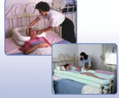
EZ ACCESS Yatakta Yıkama Sistemleri