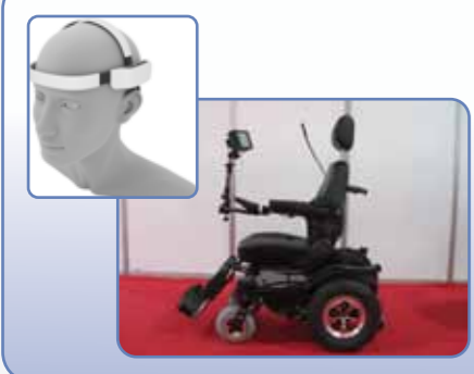
FREELZ Dış İle Kontrol Modülü