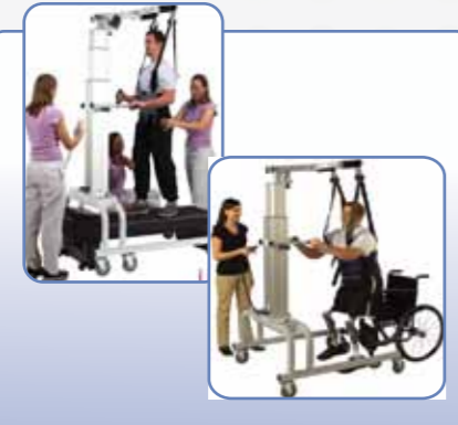
LITEGAI Fizik Terapi Cihazları