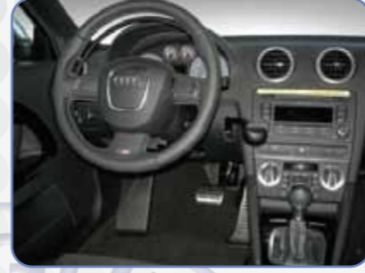
K5 Gaz Çemberi