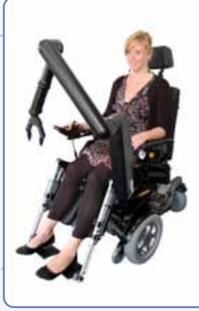
iARM Robotik Kol Desteği