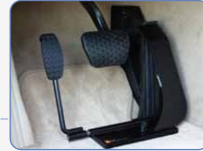
DSSA 197 Solda Gaz Pedalı