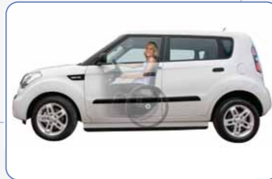
MOTION Engelli Araç Dizaynı

Özgür Bedenler Sağlık Malzemeleri San. ve Tic. Ltd.Şti. İmes Sanayi Sitesi A Blok 108 Sok. No:29 34776 Y.Dudullu / Ümraniye - İstanbul Tel: (216) 420 65 68 Faks: (216) 415 54 85 email : info@ozgurbedenler.com www.ozgurbedenler.com