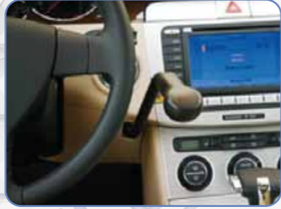
BL-BRAKE LEVEL Fren Kolu