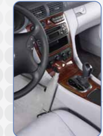
Menox Gaz Fren Sistemi