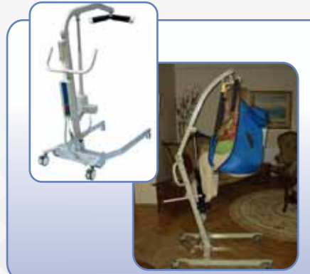
Hasta Transfer Lifti