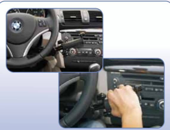
Çek-İt Gaz Fren Sistemi