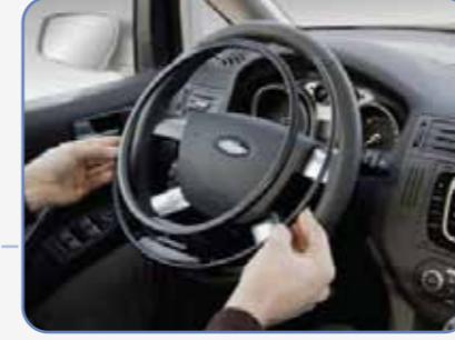
KO Gaz Çemberi