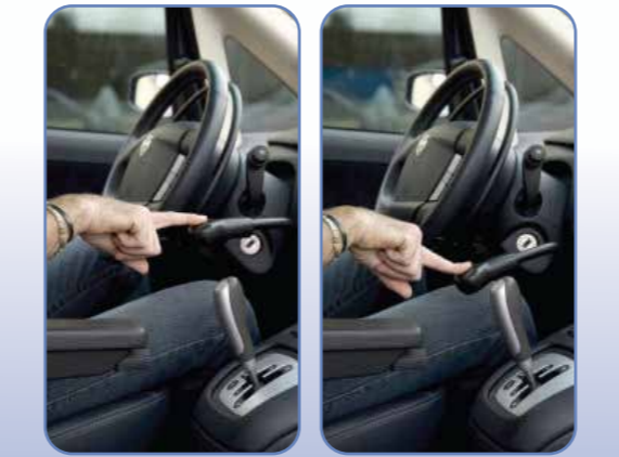
BL-BRAKE LEVEL Fren Kolu