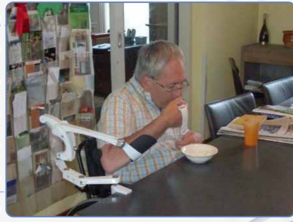
EDERO Kol Desteği